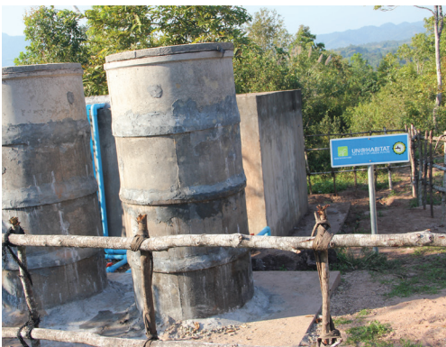
Réservoir d'eau avec système de filtre lent à sable, village de Tangko, district de Samuoi, province de Saravane, 2020.