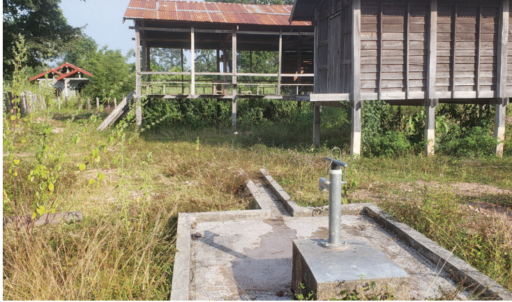
Pompe à eau communautaire, district de Sanxay.

« Avant, j'allais chercher de l'eau deux fois par jour à la rivière, à 20 minutes de mon village. Je devais marcher encore plus loin pendant la saison sèche. Grâce au projet, j'ai maintenant de l'eau dans ma maison. Je peux même faire pousser des légumes dans mon jardin ».