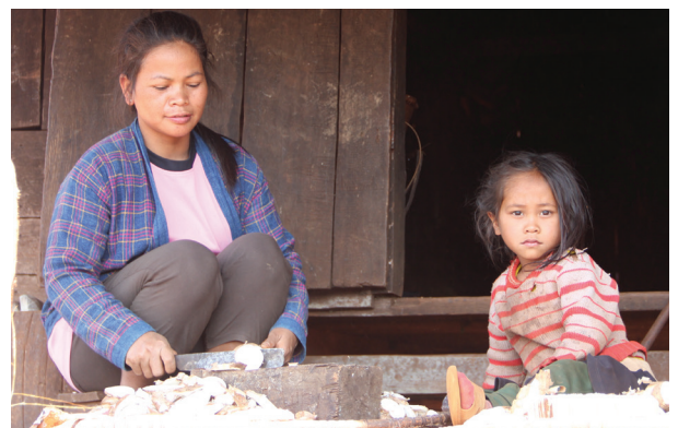
Femme coupant du melon casaba avec sa fille sur le seuil de leur maison, district de Dakcheung, province de Sekong, 2020.

FEMMES AYANT PARTICIPÉ À LA MISE EN ŒUVRE DU PROJET