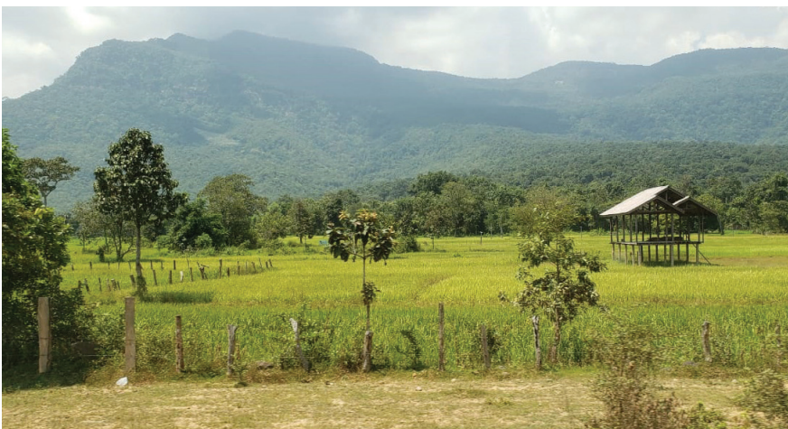
Gauche : rizières, province d'Attapeu. Droite : villageois montrant son premier robinet d'eau domestique, village de Tangko, district de Samuoi, province de Saravane, 2020.